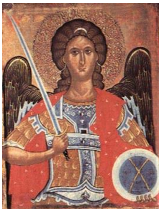
San Michele Arcangelo